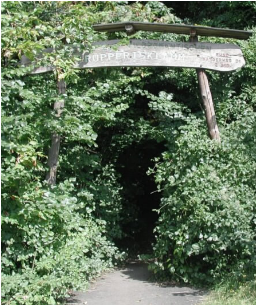
Bild des Eingangs